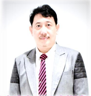
CURRICULUM VITAE AND ACHIEVEMENTS